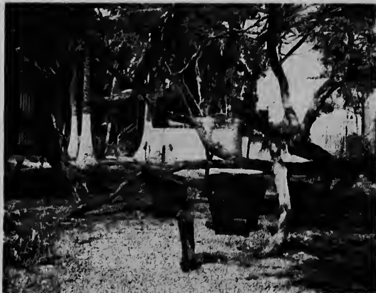
"Madiki Country Club" ta conta cu un total di 3 patio. Aki nos ta mira un hukl' un poco "aparte" na unda ta exegente e un glas den man. Den dia bo ta tapa for di e solo cayente y anochi luznan di color (so), ta aumenta un poco mas calor na e ambiente.

Un sugerencia cu nos kier a- ta pa e instancianan concerni- ma na consideracion cu e ca- tera, tanto den Belgie como ierlandstraat no ta di e ade- do ey mas pa tirenan di y cu lo ta un bon cooperacio parti di gobierno si por per- pa e camindanan menciona- un capa nobo di asfalt.